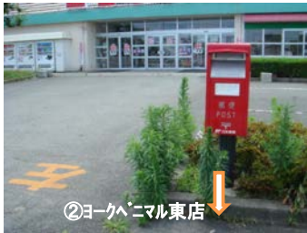
②ヨークホーム東店