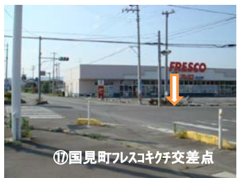
⑰国見町フレスコキチ交差点