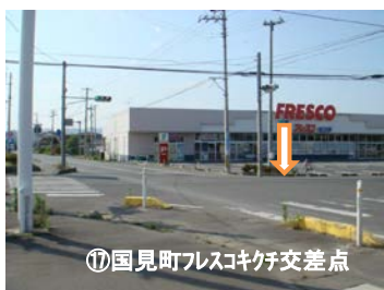
⑰国見町フレスコ街交差点