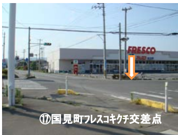
⑰国見町フレスコ交差点