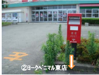
②ヨークベニマル東店