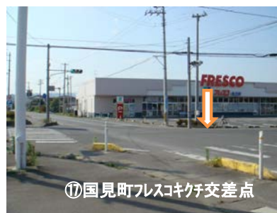
⑰国見町フレスコ交差点