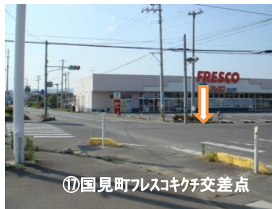
⑰国見町フレスコキチ交差点