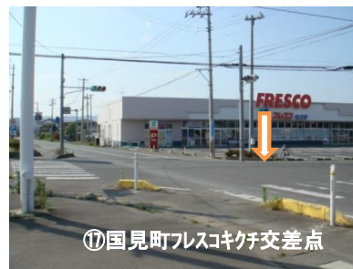
⑰国見町フレスコキチ交差点